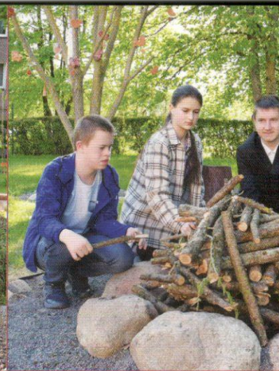
Kuosai yra aktyvūs bendruomenininkai.