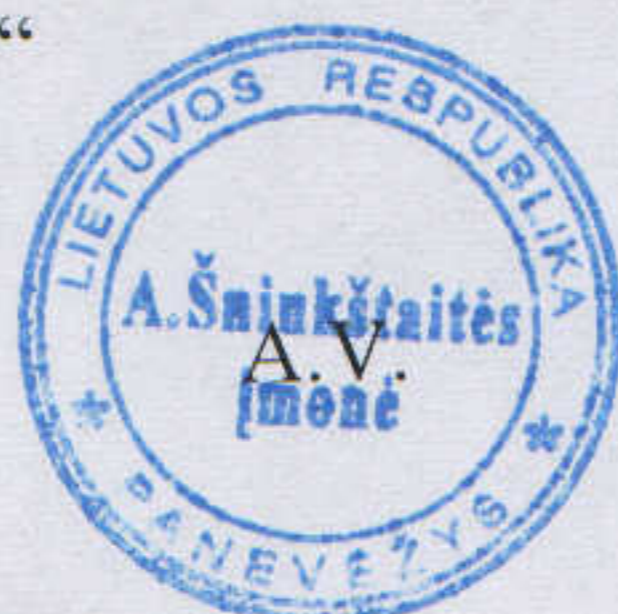
Savininkė Audronė Šniukštaitė